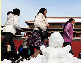
Anger after artificial storm blankets Beijing SNOWED UNDER